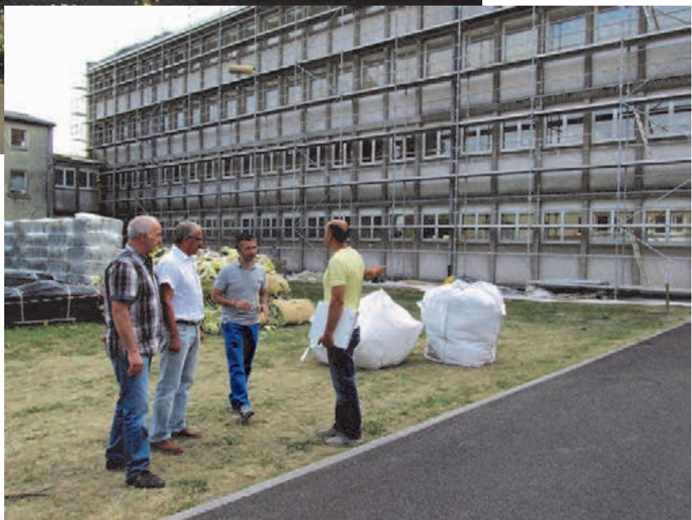
Nouvelle toiture du bloc scolaire